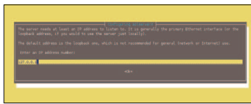
Figura 1: Uno de los cuadros de configuración en el momento de la instalación.

La distribución principal contiene una serie de módulos mínimos, aunque podemos instalar más de 70 módulos, desde el soporte de bases de datos como PostgreSQL u Oracle hasta un módulo para Aspell de corrección ortográfica. El desarrollo de módulos es bastante activo y hay una comunidad