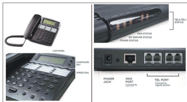
Figura 2: Hardware de telefonía IP [5].