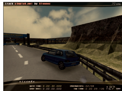
Figura 1: Debemos controlar los derrapes.

Lo que más llama la atención de este juego es el comportamiento de nuestro coche en el