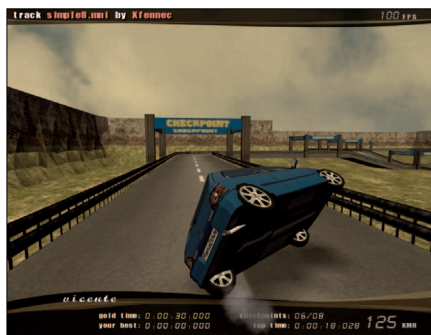
Figura 2: Un mal volantazo y nuestro coche volcará.

mundo. Incluso siendo conscientes de que la conducción ha sido simplificada para hacerlo más arcade (se han suprimido las marchas por ejemplo), la respuesta del coche es sospechosamente realista. Esto se debe a que realmente Raydium (motor del juego) incluye a su vez un motor de física real: ODE[3] (Open Dynamic Engine). Estas tres siglas son sinónimo del mejor motor físico libre que hay disponible, y eso se nota en el juego.