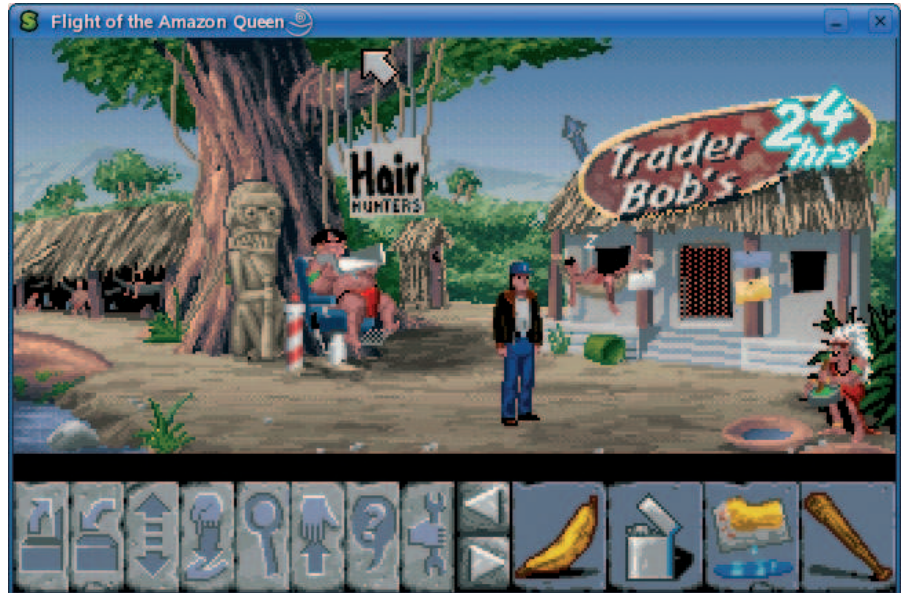
Figura 3: ScummVM trae de vuelta a la vida a viejas aventuras dándoles lo que necesitan: un intérprete de código.

Un emulador funciona como un programa normal en Linux o Windows, pero teóricamente podrías eliminar el sistema operativo anfitrión. Para que esto pueda ocurrir, nece-