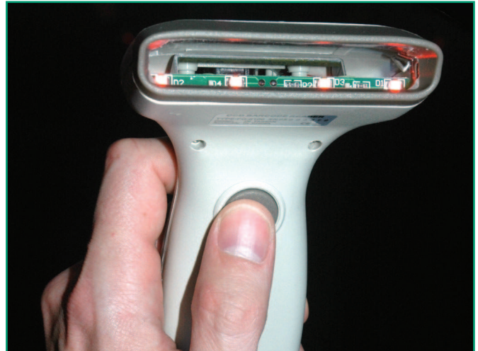
Figura 2: El escáner tiene un sensor CCD que enciende sus diodos rojos con la pulsación de un botón.

forma Tk. El cuadro de entrada de texto de la interfaz gráfica toma el foco del teclado inmediatamente tras iniciarse. Una vez que el escáner de código de barras ha identificado un código, los números aparecen en el cuadro de entrada. El escáner envía un código de retorno de carro para terminar, y la interfaz gráfica responde con la función callback scan_done() . La función envía el código de barras a los Amazon Web Services (AWS), y, tras un retardo cercano al segundo, recibe el título y autor del libro, CD o DVD más una URL que apunta a la imagen JPEG de la portada del libro o CD.