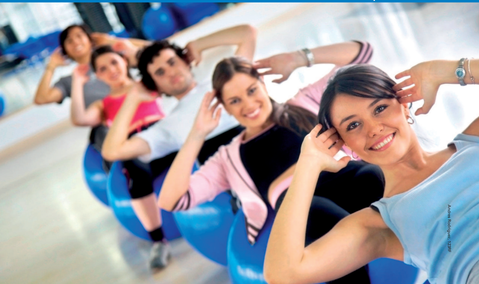
Andrés Rodríguez, 128RF

Controlando el ancho de banda con Wondershaper