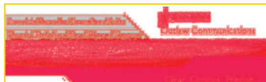
Figura 3: El comando compare crea un fichero que muestra visualmente las diferencias píxel por píxel entre dos ficheros.

Sospecho que la razón es que convert produce copias, requiriendo que especifiquemos tanto los ficheros de entrada como de salida. mogrify puede también producir copias, y para hacerlo requiere la adición de la opción format [tipo], lo cual es ligera-