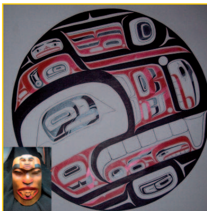
Figura 4: Composite superpone un fichero con otro segundo en un nuevo fichero. Aquí, especificando la gravedad como southwest , nos aseguramos de que el primer fichero esté posicionado en la esquina inferior izquierda.

mente más complicado y fácil de olvidar. Como ImageMagick no incluye una función undo, convert tiene una clara ventaja si cometemos un error. Aparte de eso, no existen razones por las que preferir un comando u otro.