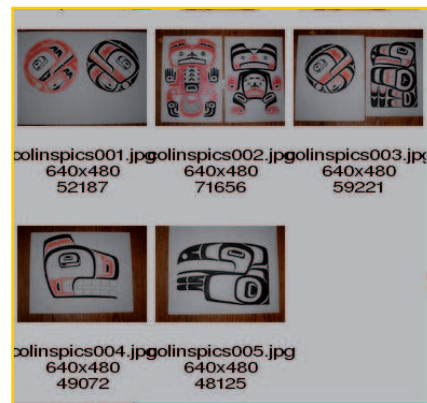
Figura 5: El comando display puede actuar como un visualizador para los ficheros gráficos del directorio actual.

Sin embargo, ninguna de esta información es lo bastante completa como la que ofrece el sitio web de ImageMagick, tanto sobre la estructura del comando en general [9], como sobre herramientas u opciones específicas [3]. El sitio del proyecto [10] tiene