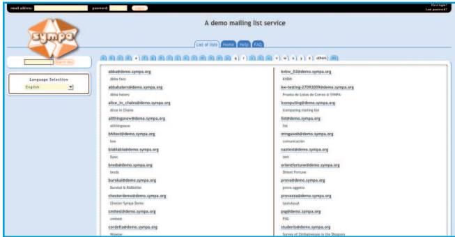
Figura 2: Los usuarios de Sympa 6 pueden seleccionar un campo de aplicación en la parte superior y las propias listas en las pestañas inferiores. El software mostrará los detalles u operaciones según se necesite en la columna de la izquierda si el usuario está logueado.

llevar a cabo una migración irreversible al nuevo mecanismo de cifrado ejecutando sympa.pl --md5_encode_password . (Es una buena idea guardar la base de datos previamente). A pesar de que la estructura del directorio cambia en Sympa 6, sigue siendo poco convencional. Si no estamos contentos con ésta, podemos pasar las rutas a configure como opciones o usar el conmutador --enable-fhs .